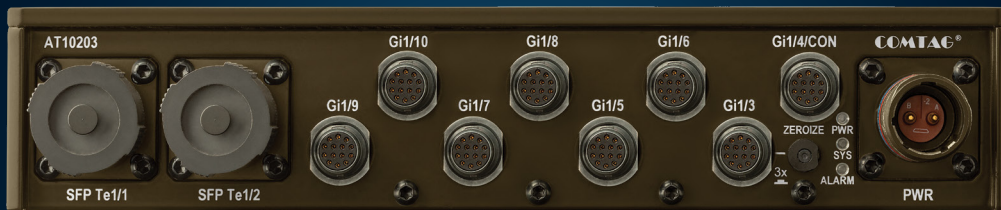
AT10203 - Predný pohľad

Je konštruovaný podľa MIL-STD-810F a MIL-STD-461F.