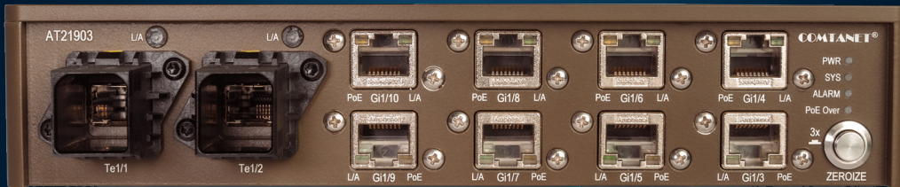
AT21903 - Predný pohľad

Poskytuje spoľahlivé a bezpečné prepínanie dát v taktických komunikačných sieťach. Prepínač je špeciálne navrhnutý na použitie na miestach velenia vojenských jednotiek, alebo civilných miestach riadenia krízových operácií. Hodí sa na prepínanie vysoko zabezpečenej dátovej, hlasovej a video komunikácie v stacionárnych sieťových uzloch. Splňa MIL-STD a je odolný proti extrémnym poveternostným a klimatickým podmienkam.